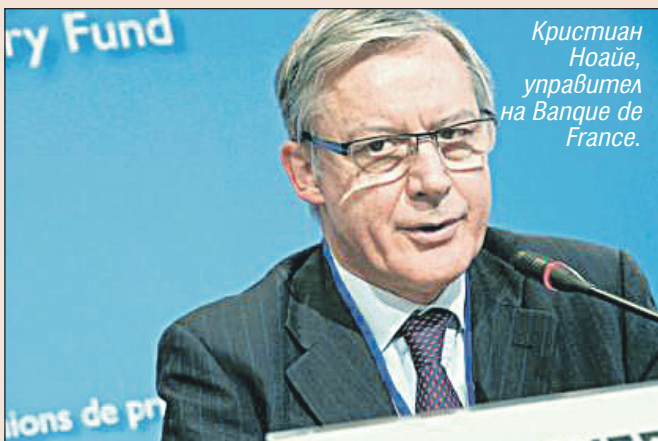
Кристиан Ноайе, управител на Banque de France.

Европейските банки са толкова стабилни, колкото финансовите институции по целия свят, а