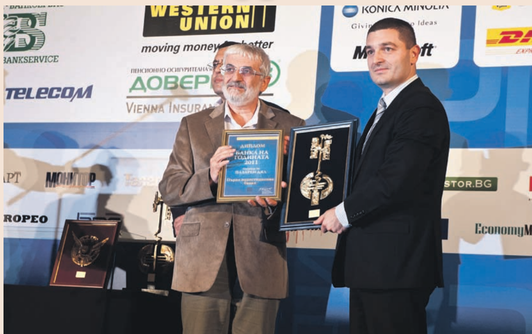
Fibank спечели и приза „Пазарен дял“ за 2011 година.