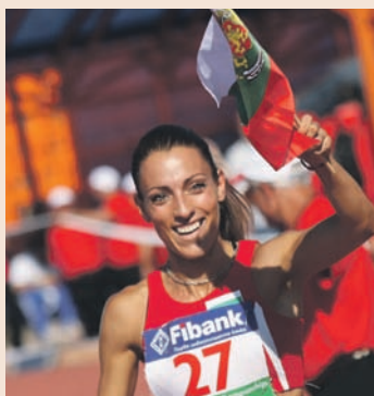
Ивет Лалова стана европейски шампион на 100 м. спринт.

Изпълнителният директор на банката Васил Христов връчи финансова премия в размер на 10 000 лв. на звездата на българската лека атлетика Ивет Лалова. Като генерален спонсор на БОК и основен спонсор на БФЛА, Първа инвестиционна банка от години помага на спортистите ни. Ивет