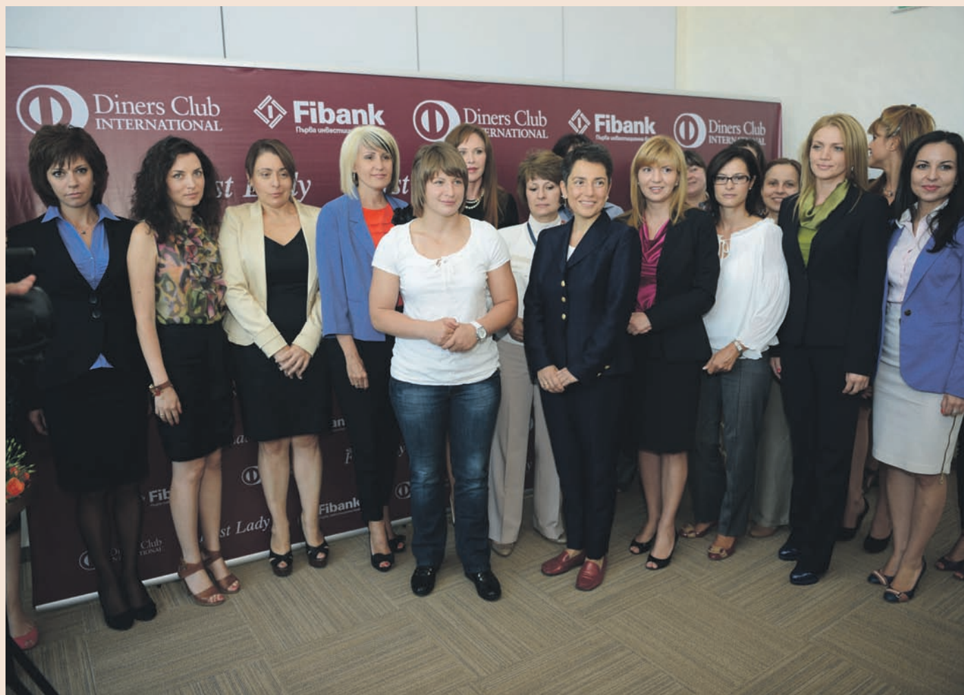
На събитието присъстваха двадесет дами-директори в банката и Дайнърс клуб България.

Наградихме най-силната жена в България за отличното ѝ представяне на Олимпиадата в Лондон