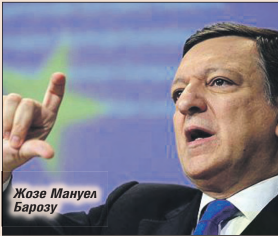
Жозе Мануел Барозу

Европейските лидери и най-вече френските и германските, постигнаха компромис снощи вечерта за постепенно задействане на банковия надзор през 2013 г., позволяващ на Европейската централна