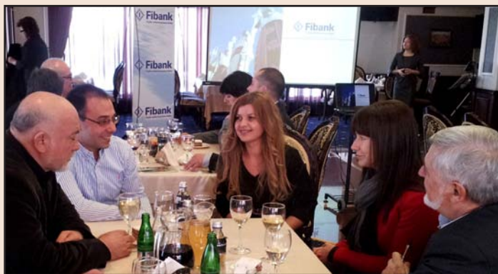
Представители на Fibank се срещнаха със земеделски производители в градовете Добрич, Силистра и Плевен.

Дискутирани бяха възможностите за подкрепа на инвестиционните намерения на земеделските стопани с финансиране