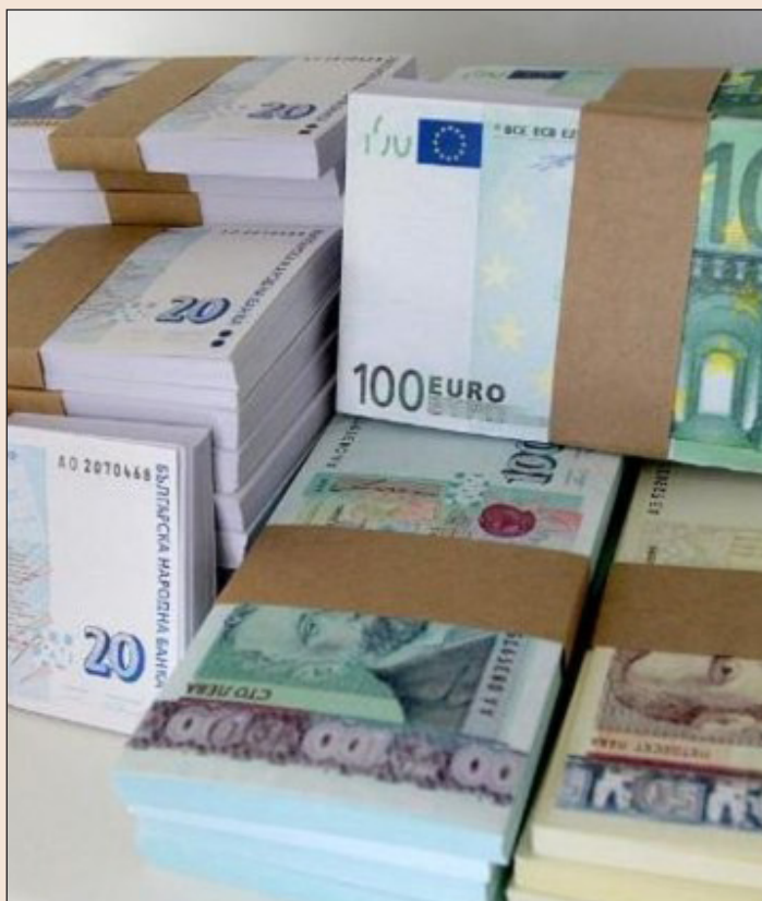
Депозитът е срочна форма на спестяване, а срокът може да е от няколко дни до няколко години.

1. Депозитът е срочна форма на спестяване, а срокът може да е от няколко дни до няколко години. Например Вие имате депозит със срок 12 месеца – т.е. внасяте средствата си по сметка при нас и на датата на падежа на депозита (края на 12-я месец от датата на сключване на договора), за вложените средства получавате договорената с Банката лихва. Когато изтече срокът на депозита, можете да изтеглите средствата или да ги прехвърлите в нов депозит и да продължите да спестявате. Условието на някои депозити разрешават да се внасят и теглят средства по всяко време. Нашите депозити можете да разгледате тук. В случай че сте избрали едногодишен депозит и сте го открили със сумата от 5000 лв. при годишен лихвен процент 5.7%, в края на дванадесетия месец (дата на падеж), при условие че