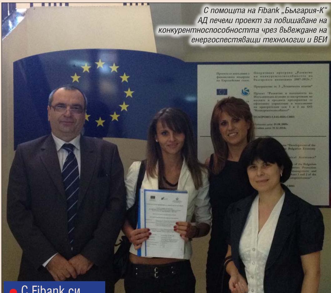
С помощта на Fibank „България-К“ АД печели проект за повишаване на конкурентноспособността чрез въвеждане на енергоспестяващи технологии и ВЕИ

С кредит от Fibank направихме една от най-модерните линии за производство на хавлиени изделия