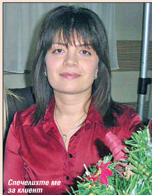
Спечелихте ме за клиент

те, които получавам, макар и на държавна работа. Непосилно е за човек със средна заплата да спести цялата сума и да закупи жилище. Затова започнах да обмислям вариант за теглене на кредит от банка. На стр. 3