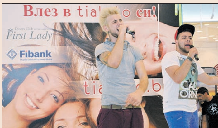
Звездите Ангел и Моисей забавляваха гостите.

Посетителите на събитието научиха как да пазаруват умно с картата си