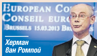
Херман ван Ромпой

Финансовите министри на държавите от ЕС ще трябва до края на юни да предприемат серия от мерки, за да елиминират схемите за измами с ДДС. В тази връзка ще започ-