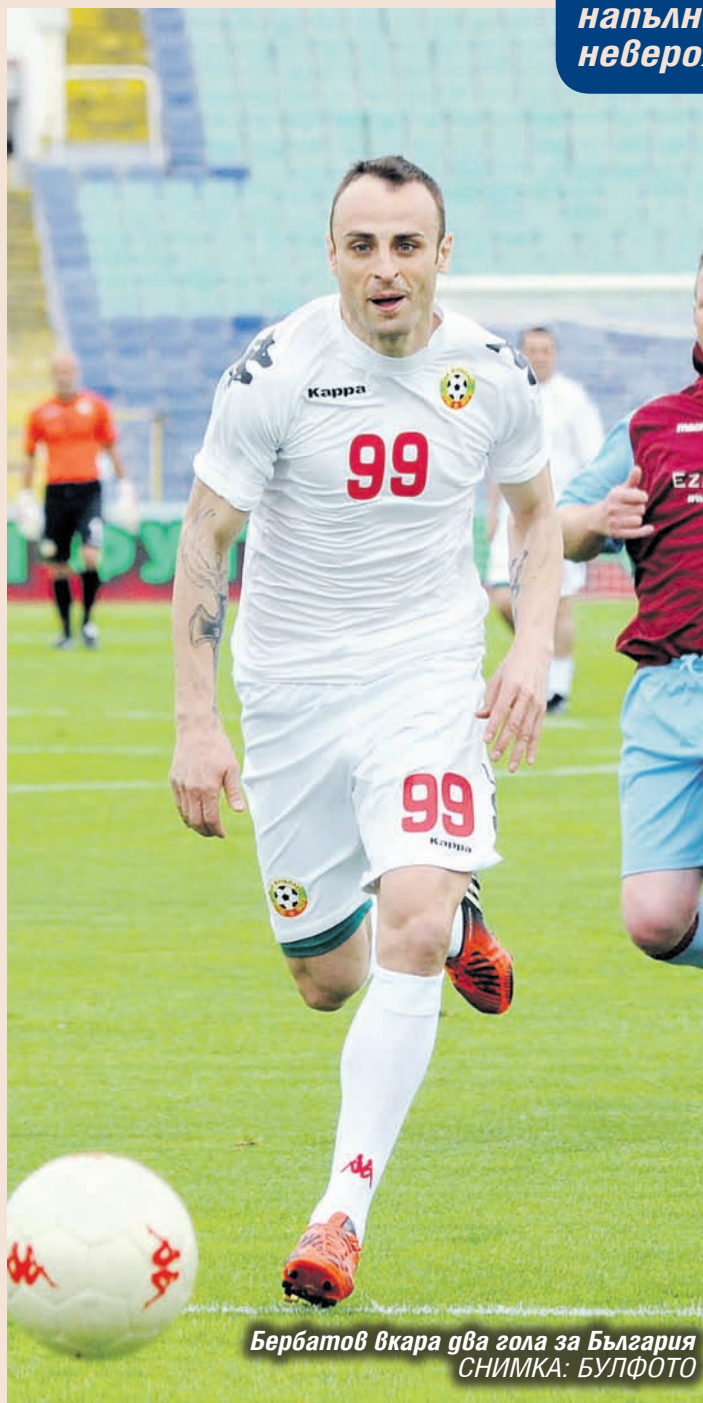
Бербатов вкара два гола за България

„Всеки път, когато излизаш с фланелката на България, е било чест и съм наистина горд, че съм носил радост на фенове-