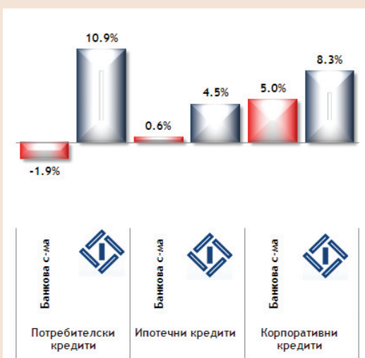
■ Графика 2. Годишен ръст на обема кредити (март 2012 г. – март 2013 г.)

*Данните са на неконсолидирана база към края на първото тримесечие на годината