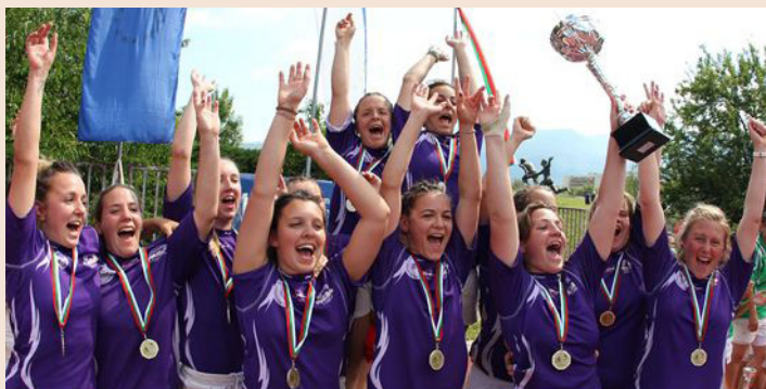
14 до 16 юни на стадиона на НСА, като това е първото първенство с такъв формат за България. Трите съ-

Fibank подкрепи първото първенство по ръгби от този ранг в България. Състезанието беше организирано под егидата на Европейската асоциация за университетски спорт (EUSA), в партньорство с НСА и Българския студентски ръгби съюз. Спортното първенство бе подкрепено и от Столична община, Министерството на младежта и спорта и фондация „Български спорт.“