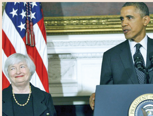
Кандидатурата на Йелън бе предложена през ноември миналата година от президента Барак Обама.

Обама определи финансистката като висококвалифициран експерт, който „разбира отлично, как рабо-