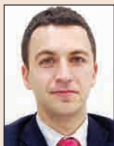
Главен специалист „Частно банкиране“