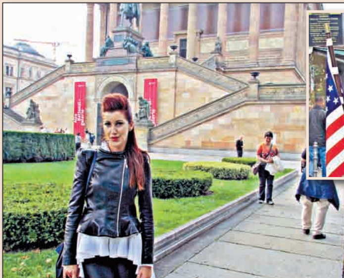
Старата национална галерия (Alte Nationalgalerie) - завършена е през 1876 г. Най-голямо възхищение предизвикват произведенията на Сезан, Реноар и Роген.

- Както повечето събития в моя живот и това премина доста екстремно все едно попаднах във филма „Голямата надпревара“ – като започна с осъзнаването на липсата на каквото и да е личен документ на летище София и покъсния полет, с който се наложи да излети. Всичко беше забравено в момента, в който кацнах и се отправих към ресторанта в Телевизионната кула, който е на 207 м височина и с нейната въртяща сфера се открива 360-градусова зашеметяващата гледка към града. Разбира се, заради голямата ми разсеяност на следващата сутрин бях забравила ваучера и картата, с които трябваше да се включа във walking tour-а в Берлин, но след бърза реакция всичко си дойде на място и успях да науча доста за историята на града. Общо взето цялата почивка премина по ръба, през първите 2 дни, докато се ориентирам с транспорта беше голямо качване и слизване. Живяла съм година и половина в Германия и със сигурност Берлин е толкова различен от това, което съм видяла преди това и с голямо удоволствие бих се завърнала отново. Като любител на клубната музика посетих Watergate, който е на 2 нива, където може да избирате кой диджей да слушате, а през