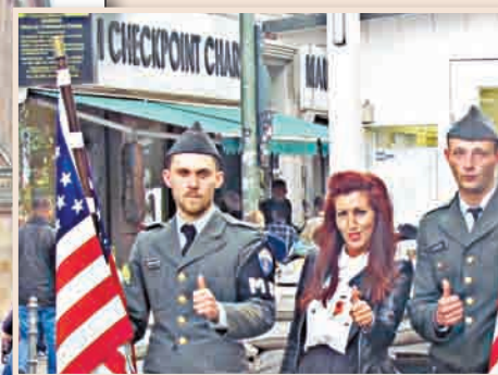
Чекпойнт Чарли е бил пропускателният пункт на американците, през който се е следяло за преминаването на коли от ГДР и ФРГ и обратно.

- Берлин е шарен, глобален, мулти-културен и различен от останалата част от Германия, ансамблите от различни архитектурни стилове хармонично съжителстват заедно. Грабва те с разнообразието си от забележителности, богата културна програма и не на последно място, със своята жива и спокойна атмосфера. Берлин е контрастът между исторически и модерни сгради, между традицията и съвременната история. Впечатление ми направи и Alexanderplatz, през който се изнизват хилядите минувачи, телевизионната кула, булевардът с липите, Берлинската катедрала, Бранденбургската врата, старият и новият парламент, авангардната