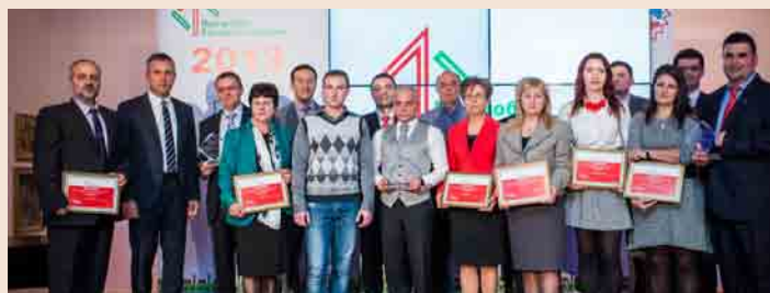
Подгласници в една от основните категории станаха фирмите „ФЕРМАТА“ АД (производство на месни продукти) и „РУДИ-АН“ ЕООД (производство на мебели за дома и офиса).

■ 220 български компании взеха участие в конкурса, организиран от Fibank