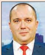
Директор „Частно банкиране“