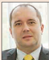
Директор „Частно банкиране“