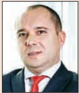
Директор „Частно банкиране“