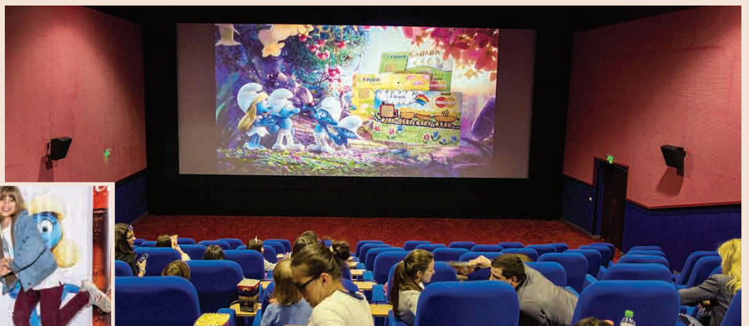
Fibank организира специална прожекция на филма „Смърфовете: Забравеното селце“. Много забавления и изненади зарадваха най-малките картодържатели, притежатели на най-цветните и весели банкови карти за деца и тийнейджъри.