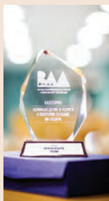
за проекта „Едно послание на Fibank“.

През 2015 година екипът на банката беше отличен и като финалист за най-добър маркетингов екип от наградите на БАР в категория Корпоративна социална отговорност