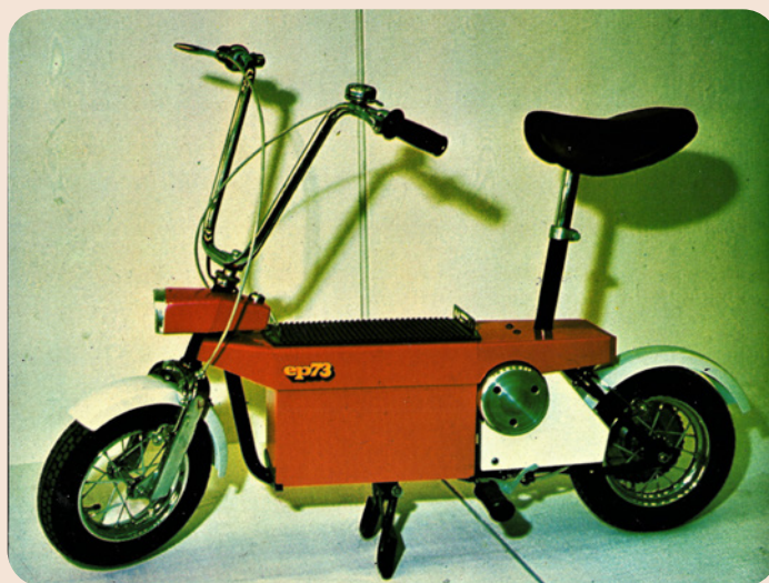
Български електрически скутер EP73

ва, разбира се, от батерията, която вече е една, но с 24 волта напрежение. Зад ел-двигателя пък е изведен конектор, за да може тя удобно да се зарежда от токоизправител в дом. условия, без да се сваля. Батерията има капацитет 55 Ah и позволява 48 км пробег при 10-ч. режим на зареждане. Тя тежи 25 кг. Ел-двигателят има 0,25 kW мощност и прави 4000 об/мин.