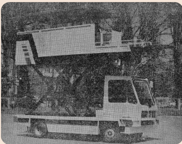
Електромобил ЕС 347

Всяка нова конструкция носи със себе си и трудности. В случая един такъв е, че помещенията са товаро-разтоварна дейност са сравнително малки и трудно