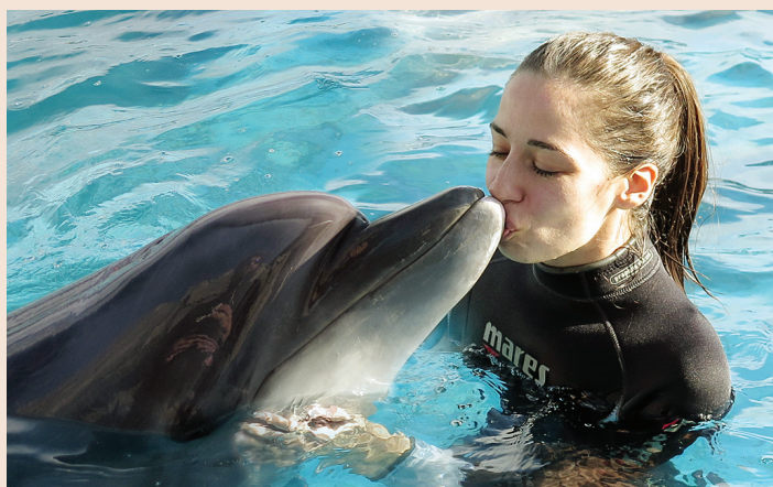
Делфинариум в Батуми, Грузия

- Не срещам особено голяма трудност, тъй като съм случила на най-страхотните семейство и приятели, които ме подкрепят във всяко едно решение и са плътно зад мен във всичко. Благодарна съм, че ги имам.