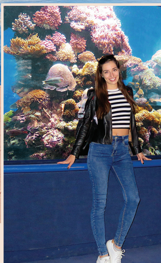
Подводна обсерватория в Ейлат, Израел

дите, шансът да можеш да управляваш финансите си през телефона е истинско улеснение. Банката на бъдещето със сигурност ще бъде свързана с още повече възможности през мобилното приложение, още повече възможности за банкиране от разстояние, още по-достъпна за всеки. Въпреки това, клиентите имат нужда от