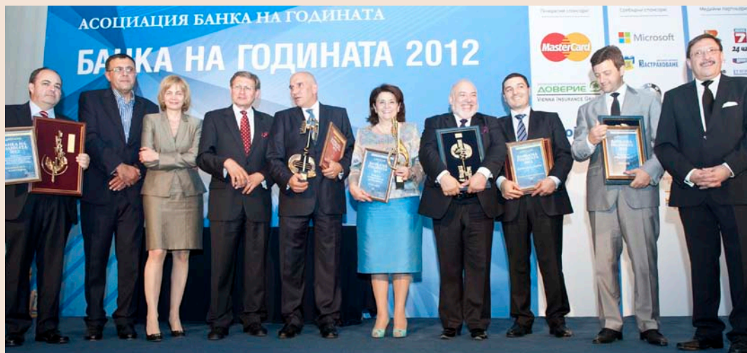
Банки спечелиха осем награди в конкурса „Банка на годината“.

И тази година Fibank бе отличена в престижния конкурс „Банка на годината“, организиран от Асоциация Банка на годината за 2012 г. Fibank е и банката, спечелила най-много награди в тазгодишното издание на конкурса – „Банка на клиента 2012“, приза за „Таен клиент“ и отличието за „Пазарен дял“.