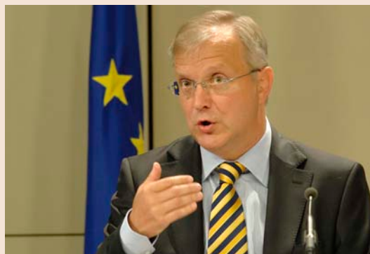
Оли Рен, европейски комисар по икономи- ческите и валутните въпроси

Атина се надява, че министрите на финансите от еврозоната ще подкрепят отпускането на транша от 8,1 милиарда евро на срещата си в понеделник, макар че гръцки представители при-