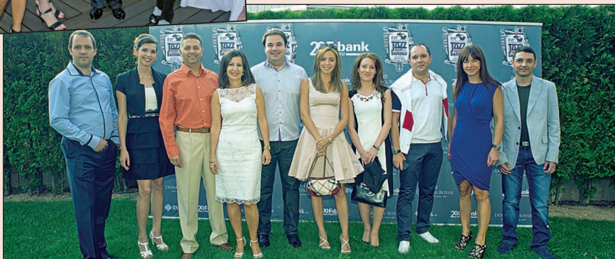
Част от екипа на Fibank (Първа инвестиционна банка)

и сценично поведение. И приликата на гласа му с този на Рей Чарлз наистина е удивителна. Както винаги организаторите се бяха постарали фесът да бъде разнообразен и интересен за широка публика, и бяха заложили на разнообразни групи и изпълнители с различен стил, така че всяка вечер имаше по