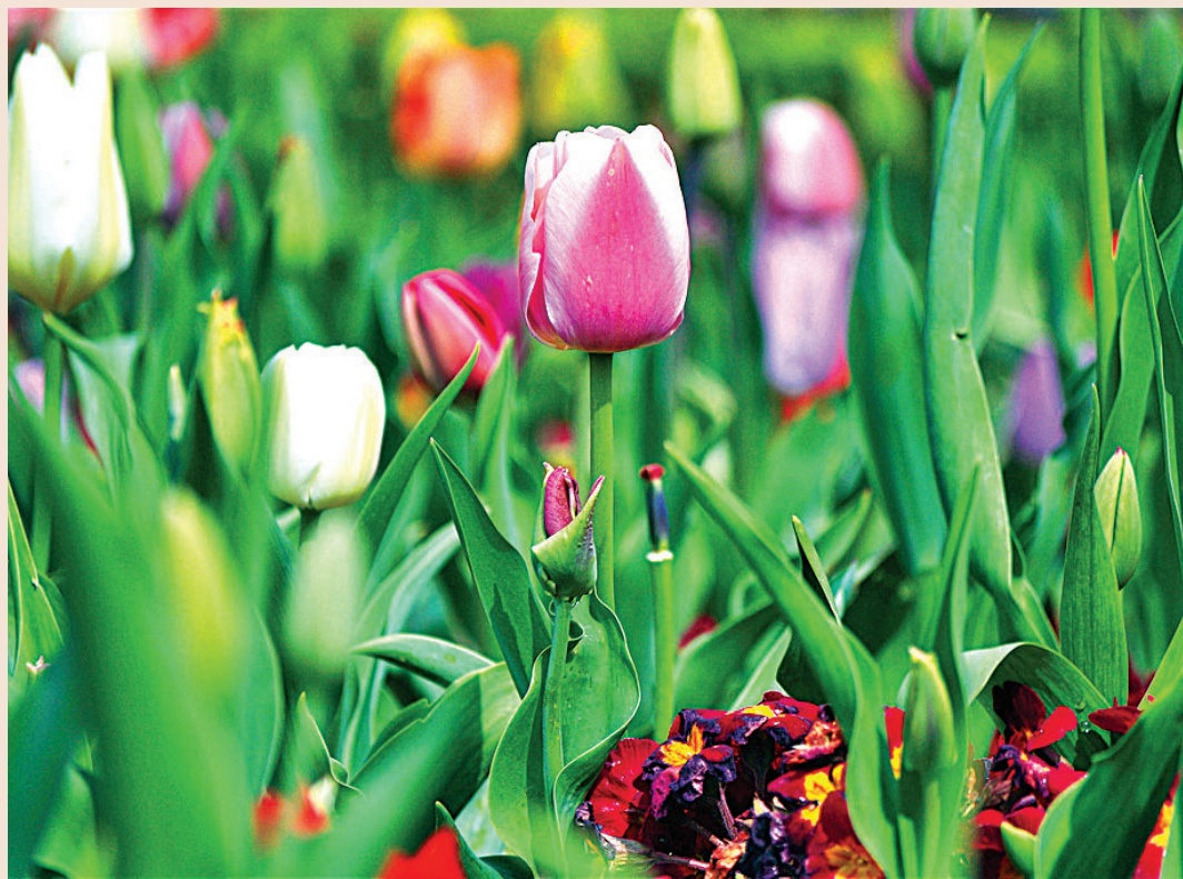
В началото на 17-ти век лалето се превръща в символ на социален статус в Холандия.

Всичко започва през 1593 г. когато фламандският ботаник Каролус Клисиус засява в градината си първите луковци, внесени от Турция. До този момент лалето е възприемано като красиво и екзотично цвете. Това спомага популярността му сред богати търговци и занаятчии бързо да нарасне, а в началото на 17-ти век цветето се превръща в символ на социален статус в Холандия.