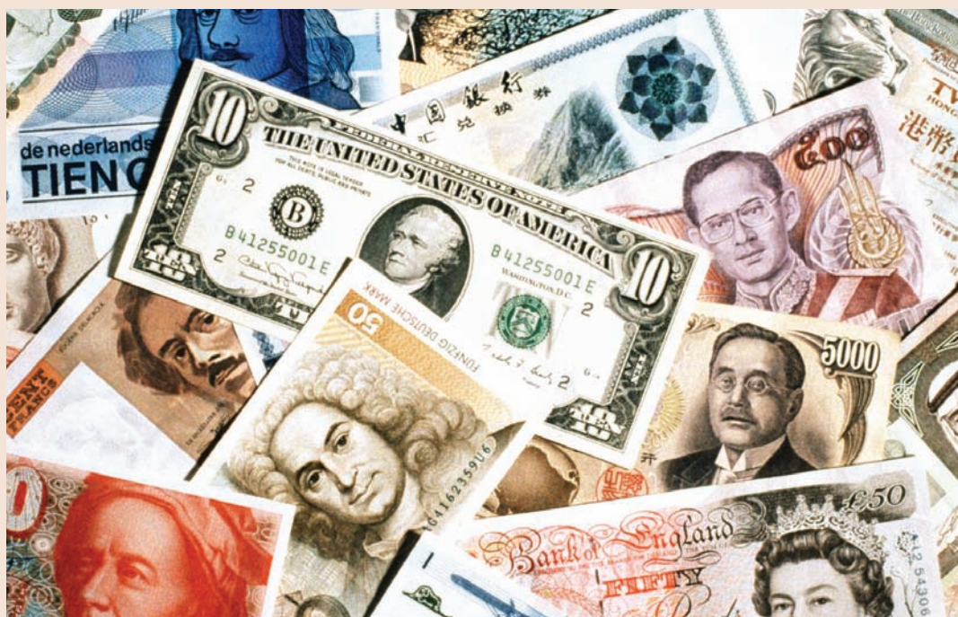
В наши дни банкнотите са с модерен дизайн и усъвършенствани защитни характеристики.

■ С развитието на платежните инструменти, най-разпространени от които са платежните карти, все повече намалява значението на парите в брой