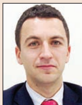
Главен специалист „Частно банкиране“